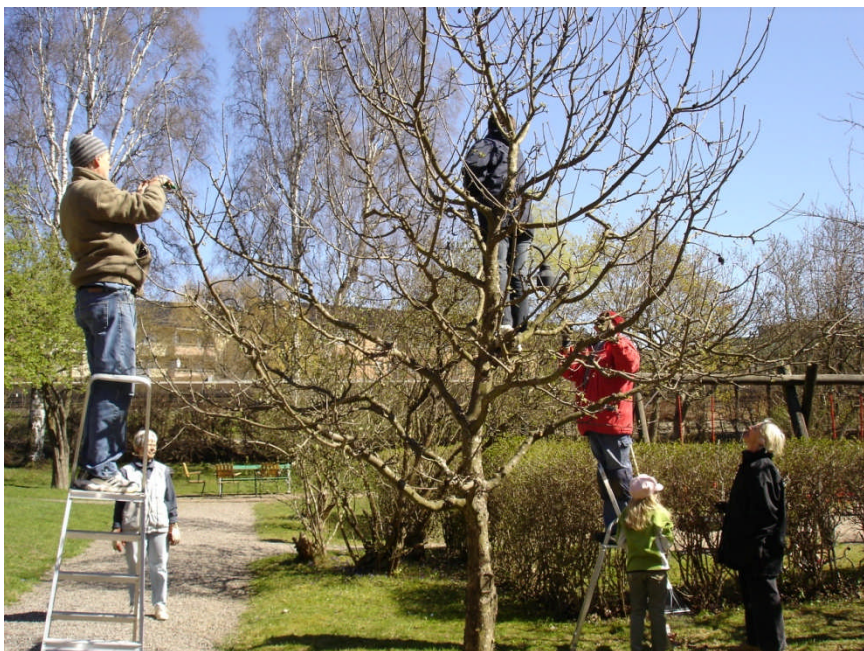
Det kan behövas många för att beskära träd

Vid behov kommer det även att bli anslagna enstaka trädgårds dagar eller kvällar då vi jobbar i trädgården och kanske grillar tillsammans efteråt.